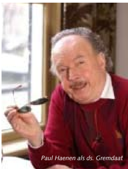
Paul Haenen als ds. Gremdaat

De conferentie op 12 maart 2014 werd geopend door ds. Gremdaat. Dominee Epe Gremdaat is misschien wel de bekendste en prettigste dominee van Nederland. Talloze mensen vinden troost en frisse inzichten door de onconventionele manier waarop ds. Gremdaat tegen het leven aankijkt. Zonder het ooit te hebben over het geloof of belerend te zijn reikt hij eenieder onverwachte manieren aan om kleine en grote problemen het hoofd te bieden, en geeft hij nieuwe motivatie om dagelijks positiever, gelukkiger en dynamischer in het leven te staan.