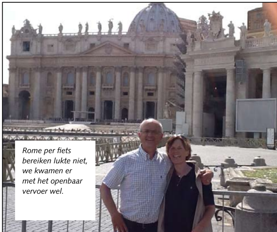
Rome per fiets bereiken lukte niet, we kwamen er met het openbaar vervoer wel.