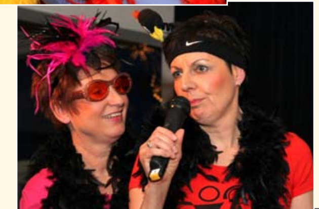
Ook dit jaar weer Schaepman-cabaret