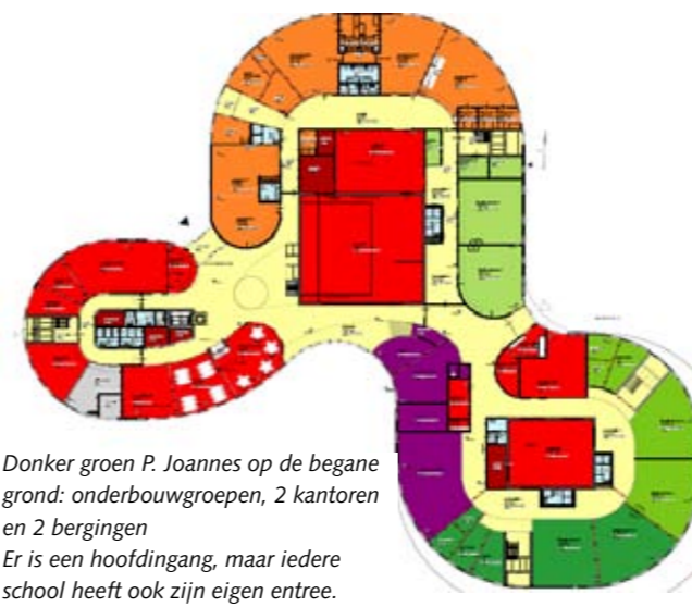
Donker groen P. Joannes op de begane grond: onderbouwgroepen, 2 kantoren en 2 bergingen Er is een hoofdingang, maar iedere school heeft ook zijn eigen entree.

Kenmerkend zijn de flexibele lokalen. D.m.v. schuifdeuren kan een lokaal groter of kleiner gemaakt worden. Wanneer ze dicht blijven ontstaan er extra ruimtes voor bijv. RT, logopedie, e.d.. Beneden en boven hebben de scholen hun eigen ruimte. Het grote centrale gedeelte is een theaterzaal compleet met inschuifbare tribune. Links naast de theaterzaal (rood) is een grote gemeenschappelijke personeelsruimte. Het voert te ver om alle ruimtes toe te lichten maar het voorzieningen niveau is erg hoog. Doordat we zolang in de voorbereidende fase hebben gezeten hebben de partners veel kunnen overleggen hoe de samenwerking in dit gebouw gestalte moet krijgen. Met een extern adviseur is er een "DNA-profiel" opgesteld. Kortgezegd: wie zijn we en wat willen we gezamenlijk zijn. Een passage hieruit voor de betekenis van het kind in deze brede school anno 2020.