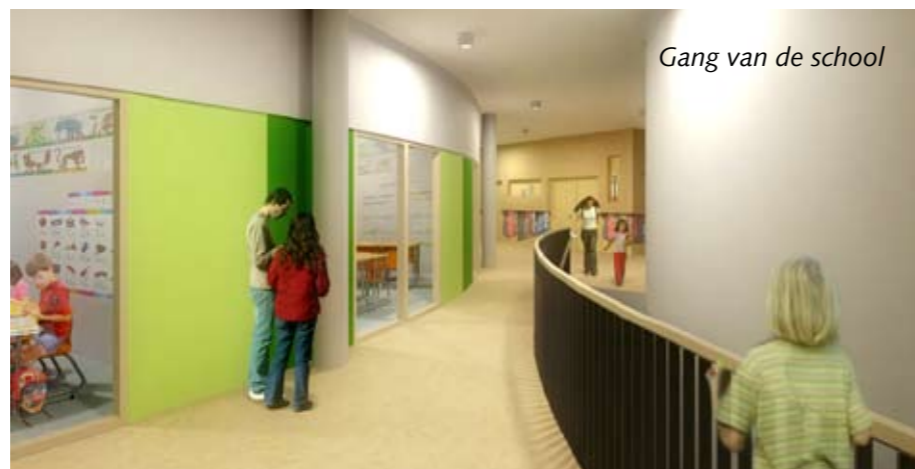
Gang van de school