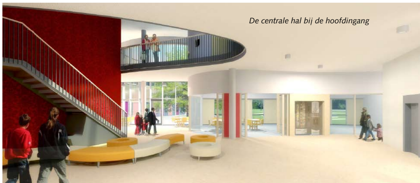
De centrale hal bij de hoofdingang