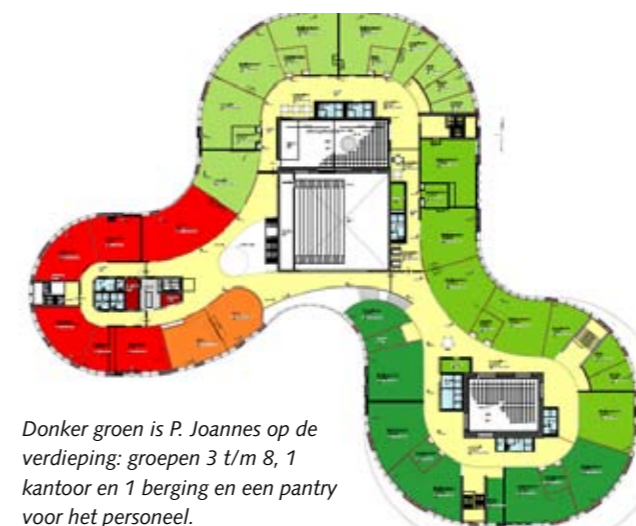
Donker groen is P. Joannes op de verdieping: groepen 3 t/m 8, 1 kantoor en 1 berging en een pantry voor het personeel.