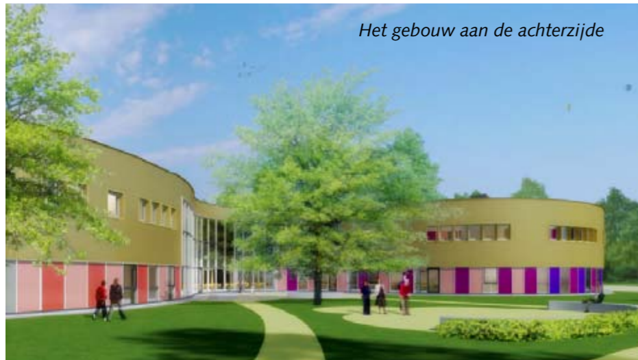
Het gebouw aan de achterzijde

Zoals waarschijnlijk bekend, gaat de Paus Joannes XXIII-locatie onderdeel uit maken van deze brede school. Het is gekoppeld aan een multi functionele accommodatie (MFA) waarin andere partners gevestigd zijn. Voor de zomervakantie is er een wedstrijd uitgeschreven voor een geschikte naam. Het is "t Berflo" geworden. Het gebouw wordt min of meer tegenover het FBK-stadion gerealiseerd. De naam is geïnspireerd op de Berfloboek die door deze wijk stroomt. Omdat 't Berflo midden in het waterwingebied ligt en straks omgetoverd wordt tot het "Wartorenpark", is de link met het water heel logisch. Na een aanloop van meer dan 7 jaren, is de bouw vlak voor de vakantie van start gegaan.