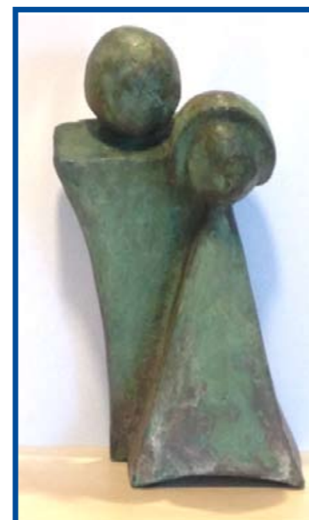
Het Schaepmanlogo verbeeld in zink

Geen uitgebreid woord van de redactie dit keer. De artikelen en foto's spreken voor zich. Vanwege ruimtegebrek ook geen column. Rest ons, na een schooljaar waarin iedereen zich op zijn of haar eigen wijze heeft ingezet voor de aan ons toevertrouwde kinderen, een goede en zonnige vakantie toe te wensen. Doe veel energie op want de vakantieweken zijn snel voorbij en er ligt weer een nieuw schooljaar op u te wachten.