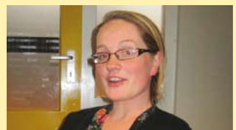
Ellen: "Erg leuk en inspirerend."