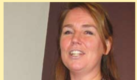
Saskia: "Motiverend en inspirerend."

Tenslotte denken deze collega's dat zij "afzwaaien" als verschillende types (aspirant) directeuren omdat de basiscompetenties, de aanleg en voorkeuren verschillend zijn.