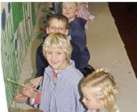
Kinder beider Nationen schmückten einen Flur mit gemalten Blumen. Andere tobten in der Sporthalle.