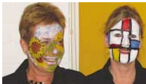
Een speciale manier van inleving in de stijl van de kunstenaar.

Twee kunstenaars, verbonden aan het Kunstcentrum Hengelo hebben gedurende een week een les verzorgd in alle groepen. In deze les werd er samen met de kinderen gekeken naar gezichten, uitdrukkingen en portretten in verschillende stijlen uit de kunstgeschiedenis. Er werd uitleg gegeven