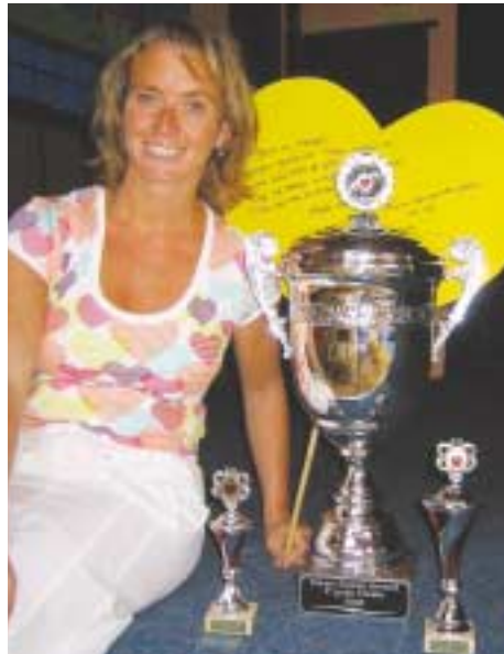
De prijzenkast van De Schothorst is te klein voor de grote bokaal.

dans uit pure hobby heeft eigenge- maakt. De verzoeking van de leerlingen en van leerkrachten begon logischerwijs te komen. Er is toch ook nog meer... Maar de overwinning in het Rabotheater met een plaats in de halve finale in De Flint in Amersfoort gaf direct weer die nieuwe energie. En toen