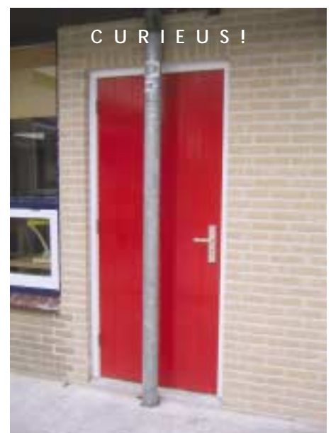
Een wel erg hermetische afsluiting bij de Schothorst!

Het bestuursbureau van de Dr. Schaepmanstichting gaat binnenkort verhuizen naar Enschedesestraat 68, 7551 EP Hengelo Telefoon- en faxnummer blijven hetzelfde. De scholen ontvangen binnenkort bericht over de definitieve datum van verhuizing. De e-mail-adressen zullen dan ook gewijzigd worden.