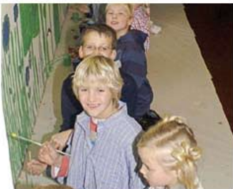
Kinder beider Nationen schmückten einen Flur mit gemalten Blumen. Andere tobten in der Sporthalle.