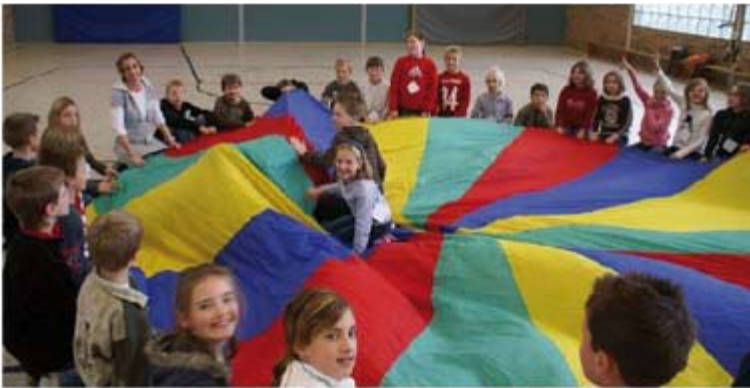
In und an einem Schwungtuch vergnügten sich deutsche und niederländische Schüler in der Sporthalle. Den ganzen Tag über gab es solch bunte Aktionen.